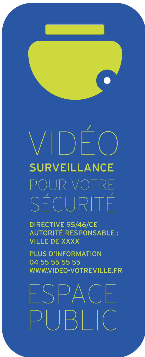
Panneau type Dôme