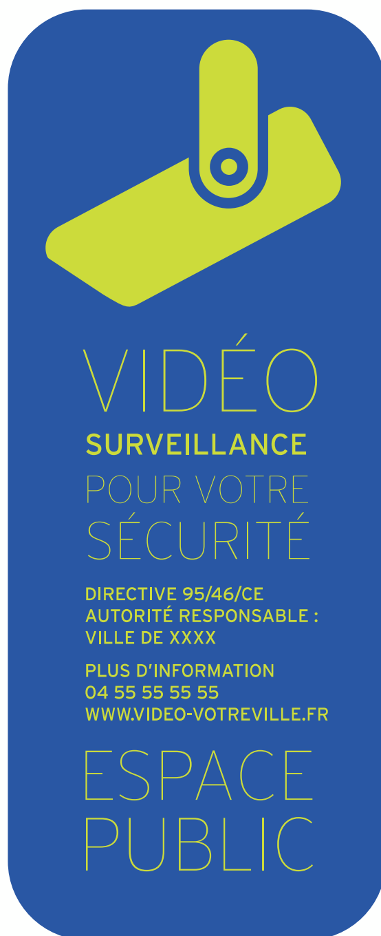
Panneau type Caméra